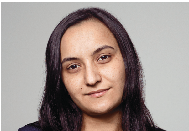
Vara til Stortinget: Seher Aydar.

– Befolkningen i Groruddalen har vært kasteballer i over ti år. Nå er det på tide at de endelig får Aker som sitt lokalsykehus igjen. Men det finnes ingenting i Helse Sør-Øst sine styredokumenter og planer som tyder på at Groruddals-befolkninga skal overføres samlet til et nytt Aker sykehus. En nedleggelse av Ullevål vil gi en dominoeffekt som fører til at Groruddalen ikke