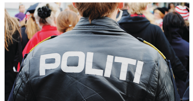
Fjernere fra folk: Har nærpolitireformen virket mot sin hensikt?