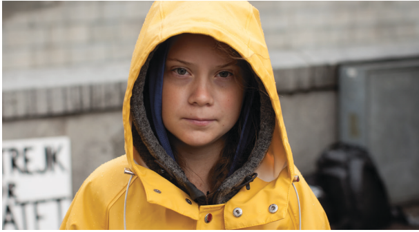
Klimaaktivist: Greta Thunberg.