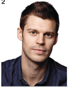
Bjørnar Moxnes b.moxnes@roedt.no Leder i Rødt