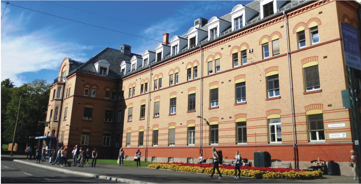
Planlagt nedlagt: Ullevål sykehus.