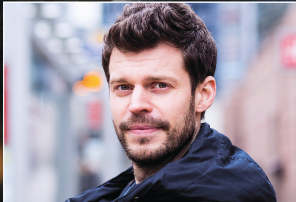
Leder i Rødt: Bjørnar Moxnes.