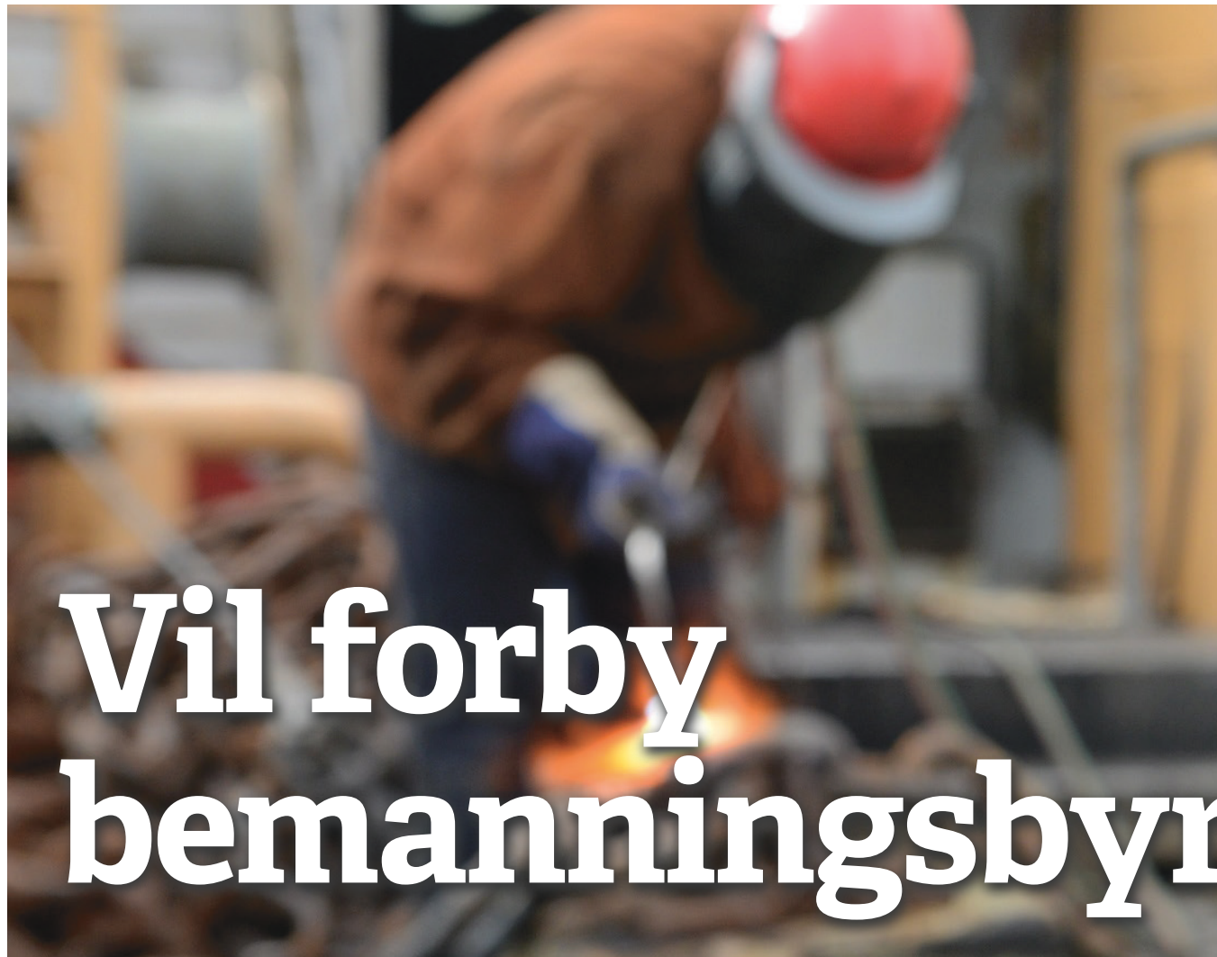
Lar seg ikke regulere: Bemanningsbransjen.

Utgiver: Rødt Dronningens gate 22 0154 Oslo