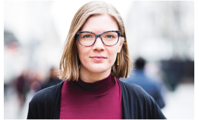
Rødt-nestleder: Marie Sneve Martinussen.