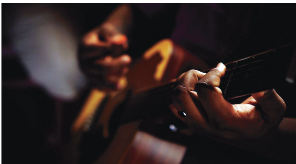
Under press: Kunstneres ytringsfrihet.